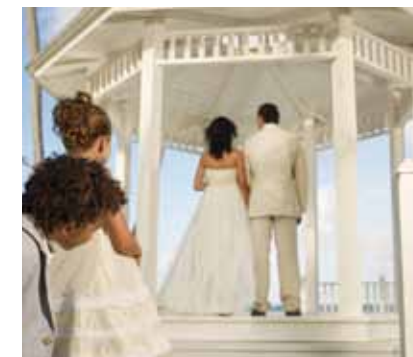
NH Real Arena

Viva Wyndham Resorts vivaresorts.com 800-WYNDHAM