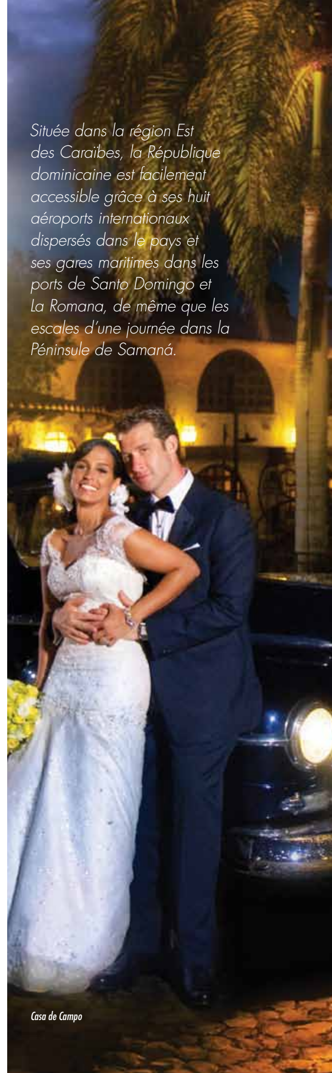
Casa de Campo

Située dans la région Est des Caraïbes, la République dominicaine est facilement accessible grâce à ses huit aéroports internationaux dispersés dans le pays et ses gares maritimes dans les ports de Santo Domingo et La Romana, de même que les escales d'une journée dans la Péninsule de Samaná.