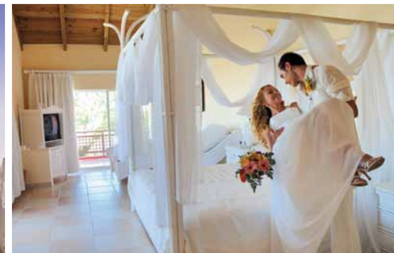
Couverture : Hôtels Princess